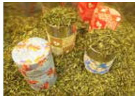
お茶筒にいっぱいしてください

京都の銘菓をはじめ、京都名物お漬物や ちりめん山椒、ちきりや茶舗店主の 気まぐれ「お茶の詰め放題」など よりどりみどりで どうぞお楽しみください!!