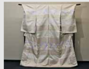
本金の訪問着 細かな織りの中に本金が きらっと光ります