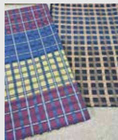
吉野間道の袋帯 お洒落ものにもお使い頂けます

西陣の伝統工芸品と言えば、「先染（さきぞめ）の紋織物」のことを指します。そして「西陣織」には十二品目の種類があります。それぞれ一つの技法を用いたもの、いくつかを組み合わせ合わせたものもあります。今回はその中でも9つの織物をつくっている機屋さんの作品です。